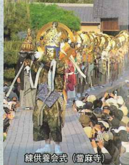
練供養会式(當麻寺)